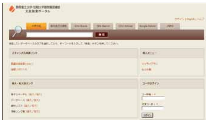
文献検索ポータルトップページ

各図書館 Web サイトの【蔵書検索】ページにあるリンクから利用できますので、文献検索のポータルサイトとして活用してください。